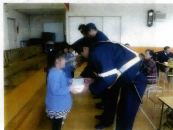
プレゼントもいただきました🎁