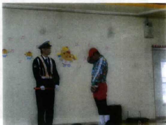
何と😊おまわりさん、劇も披露してくださりました🎶