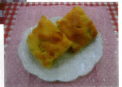
『さつま芋のガレット』