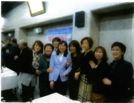
懐かしい恩師と会話をしたり、記念写真を撮影したり、とても和やかな雰囲気でした。