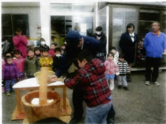
大きなきねも、おまわりさんと一緒に持つとハっちゃらです🍡

事業名 : 餅つき交流会 日時 : 平成 25 年 12 月 26 日 (木) 午前 10 時～ 目的 : 地域の方々や復興支援で来ていただいている警察官の方々との交流を図る