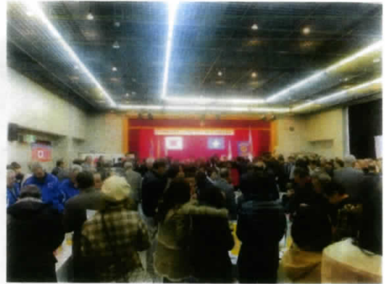
壮行会の会場となった山田中央公民館の小ホールには、友里香さんを応援しようと約 200 名の方が集まりました!