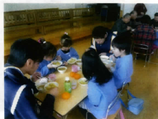
みんなで力を合わせてついたお餅、『いただきますーす』🎶