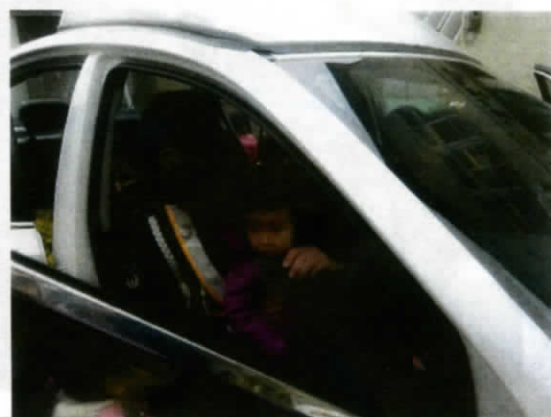
かっこいいー😊おまわりさんに変身🚗