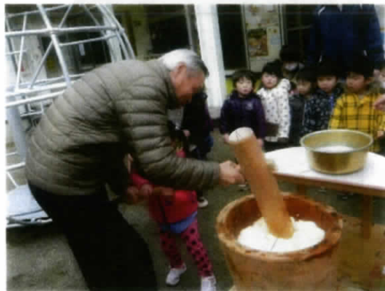
『もう少し、がんばれー😊』