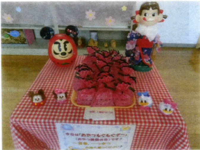
『サーターアンダギー』