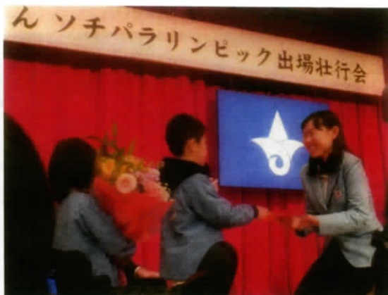
友里香さんの後輩、山田第一保育所の園児から花束と色紙の贈呈です。