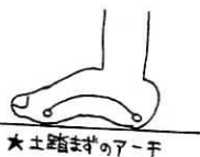
★土踏まずのアーチ