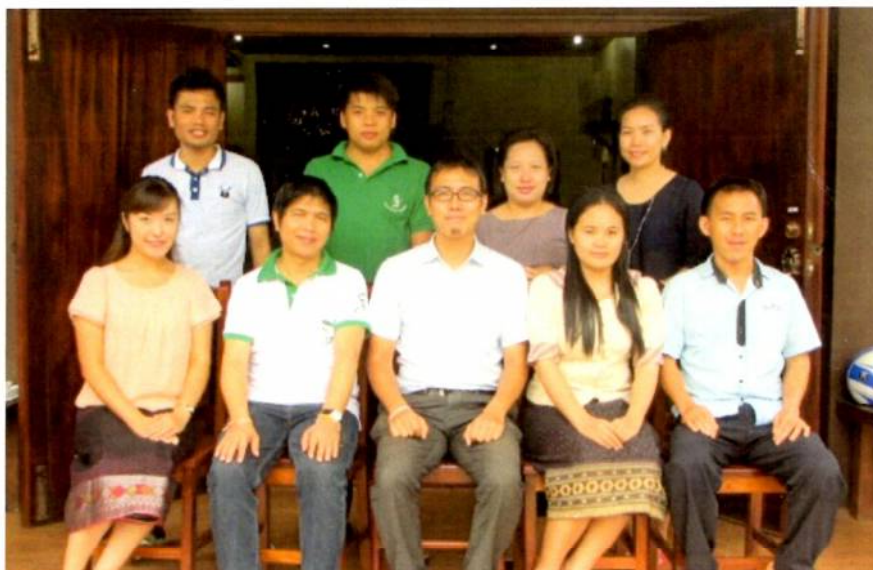
シャンティ・ラオス事務所 職員一同